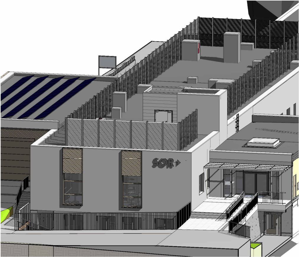
Wejścia na SOR 3

ZMIANA WITRYNY WEJŚCIOWEJ, REZYGNACJA Z PRZEDSIONKA ORAZ ZMIANA GEOMETRII PLATFORMY WEJŚCIOWEJ, RAMPA NA DRUGĄ STRONĘ